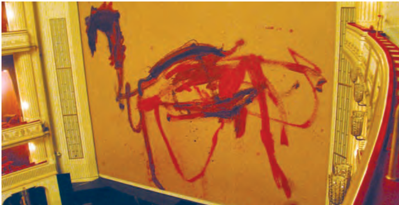
С первого взгляда занавес к опере «Орест» обещает, что когда он поднимется, на сцене произойдут события, достойные настоящей трагедии...