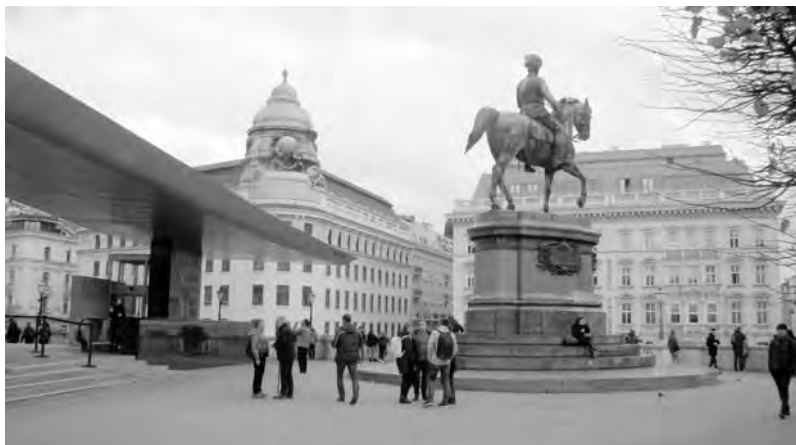
Перед дворцом-музеем «Альбертина» – конная статуя Альберта Саксен-Ташинского