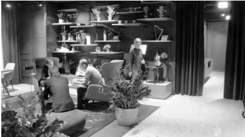
Гостиница напротив носит то же название. В ней останавливаются знаменитые музыканты и актеры, и мы, когда это удастся

колпаках, да и самим мастером, предстающим на автопортретах разных лет и загадочным красавцем, и гением Северного Возрождения.