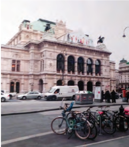
На спектакли в Венской опере публика приезжает и на «мерседесах», и на велосипедах