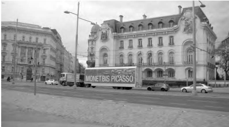
Вот на таких огромных трейлерах перевозят в венские музеи работы великих мастеров. На сей раз – Моне и Пикассо

сами, и милая молодая особа – Гретхен, но лукавая, – дочь тенора, того, что постарше.