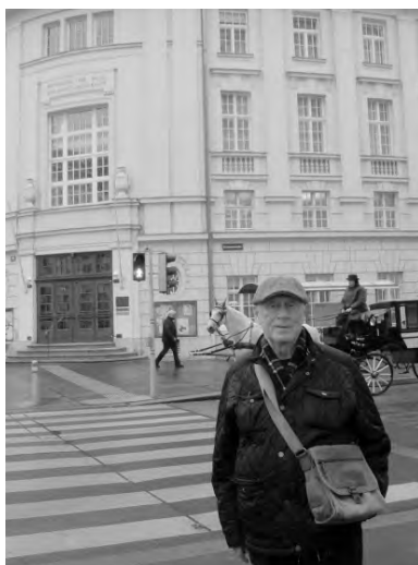
За моей спиной – фрагмент огромного круглого здания «Концертхауса», созданного по проекту «наших» архитекторов Фельнера и Гельмера. Здесь размещаются несколько концертных и театральных залов