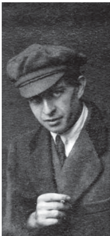
Эдуард Багрицкий. 1919 г.