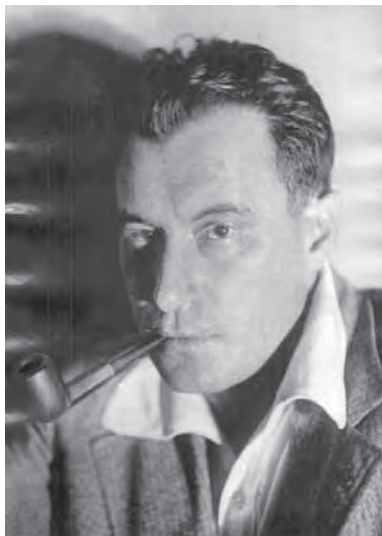
Валентин Катаев. 1920-е гг.

Но вернемся к «Бездельнику Эдуарду» – описанию жизни Эдуарда Багрицкого в начале 1920 года. Глава III. «Но он не унывал»: «Между тем валила зима. Ветер свистал в обледенелых обломках дач. Косматое сине-зеленое море ходило и раскачивалось тяжелыми горбами, разбиваясь вдребезги о волнолом и вскипая пеной, которая летала чайками над голыми эстакадами и хоботами подъемных кранов. Население окраин рубило по ночам деревья, выкорчевывало лимонные твердые корни акаций, ломало дачи и заборы, срывало ставни и лестницы. И громадные осенние созвездья, раздуваемые ледяным вихрем, пылали и переворачивались в железном небе.