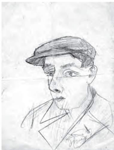
Багрицкий, 1920 г.