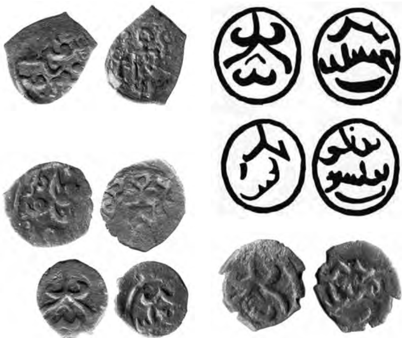
Монеты Кутлуг-Болсун «Будь счастлив!»

ал-Джедида – «Нового города»). Это городище в Старом Орхее, в Прутско-Днестровском междуречье, в долине реки Реут, в тогдашних владениях эмира Дмитрия. Это означает, что к 1363 г. Кельдибек со своим «походным» монетным двором там очутился сразу же после битвы при Синих Водах. Значит, побежденные в ней мятежники бежали именно сюда. В это же самое время в Костештах, по соседству со Старым Орхеем, появляются монеты, которые помечены штемпелем Кутлуг-буги с легендой «Кутлуг болсун», что переводится как «Кутлуг позволяет» ( кыпчакск. « bolsun » – « позволено », « пусть будет », « да будет так ») 25 . А это значит, что Кильдибек бежал сюда вместе с Кутлуг-бугой. Единовременное функционирование на соседних городищах монет Кильдибека