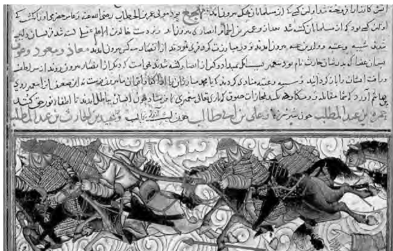
Сражение. Миниатюра XIV в.

Наврुза, Хызра. Он мог опираться на Кутлуг-бугу как правителя Крымского тумена и предводителя всех эмиров правого крыла Золотой Орды. Тогда такая поддержка отца была ему выгодна и необходима.