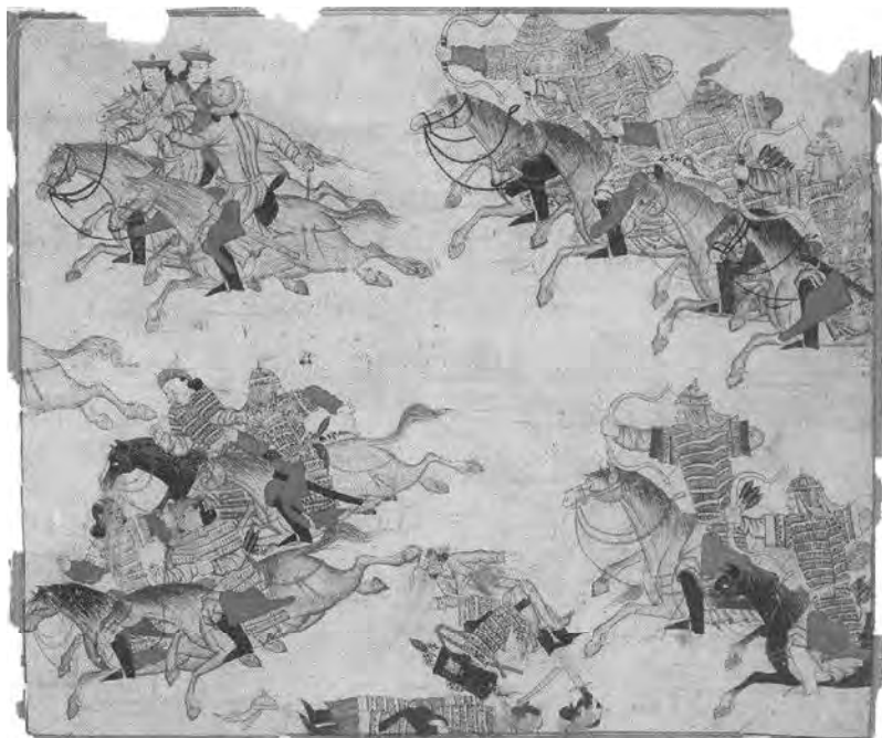
Конное сражение . Миниатюра XIV в.

Между тем достоверно известно, что имя «исчезнувшего» Кильдибека появляется монетах Янги-Шехра (или Шехр