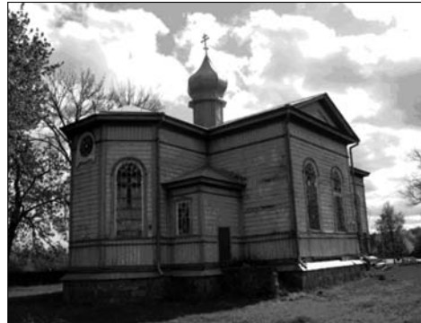
Деревянная церковка без гвоздей