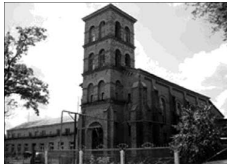
Костел построен в 1857 г.

В Мошнах сохранились два из четырех корпусов больницы, спроектированной и построенной в 1909 г. молодым архитектором Владиславом Городецким, ставшим позже выдающимся архитектором. Деревянные постройки украшены прихотливой резьбой.