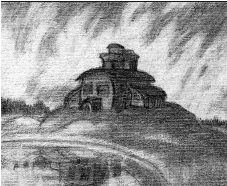
Композиция — 47. 10,5 x 13, бумага, карандаш, 1918.