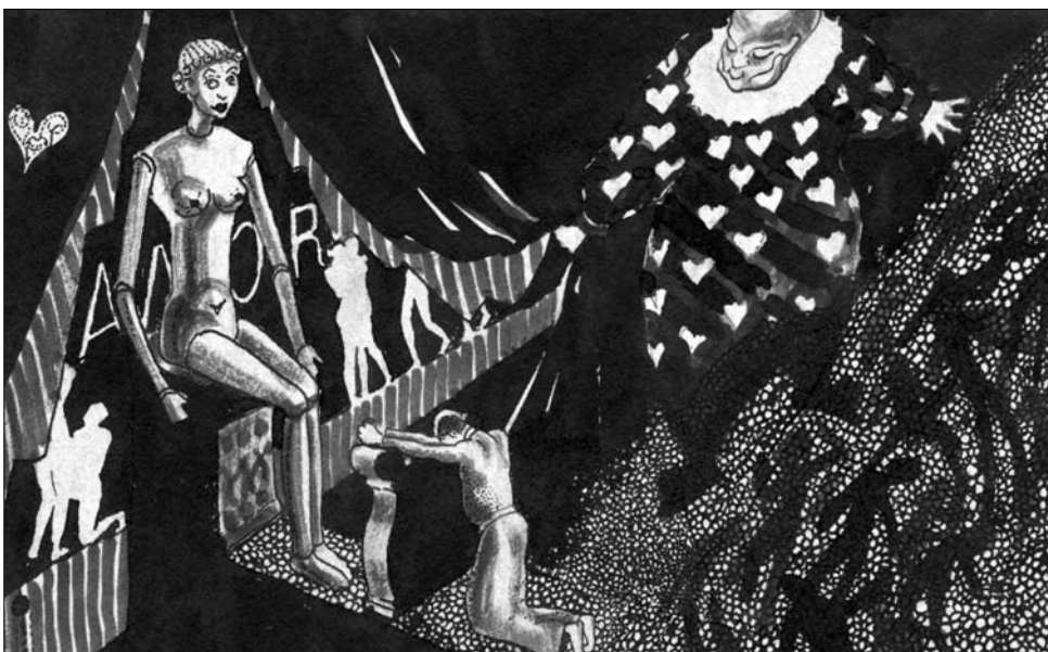
Амор. 9,8 x 15,6, бумага, тушь, 1918.