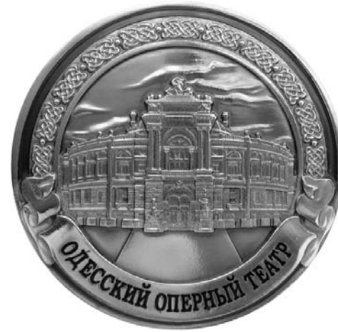
Памятная медаль "220 лет со дня основания Одессы. 1794 — 2014. Одесский оперный театр", бронза, литье, золочение, эмаль, лак. Вес 100,6 г, диаметр 55,5 мм, толщина 6 мм.