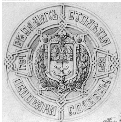
Эскиз медали в память столетия г. Одесса. Н. Розетти. 10 декабря 1893 года.