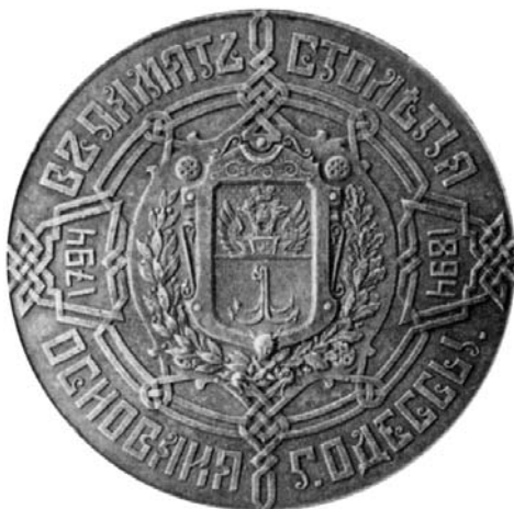
Медаль в память 100-летия основания Одессы.