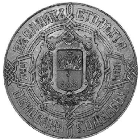
Медаль в память столетия основания Одессы. Вариант И. Рухомовского. Бронза. Вес 175,2 г, диаметр 70 мм.